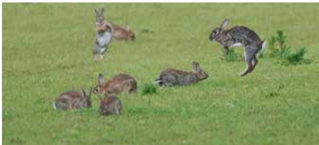
Een blij konijn maakt binkies.

Een gezond konijn is alert, eet goed en reageert op nieuwe prikkels van buitenaf. Dit betekent niet dat je konijnen de hele dag actief zijn. Konijnen zijn vooral in de schemering en 's nachts actief, waardoor voldoende ruimte voor beweging dus niet alleen overdag belangrijk is. Overdag liggen ze vaak rustig, soms zelfs helemaal plat op hun zij of languit gestrekt op hun buik. Dit is normaal konijnengedrag. Konijnen die goed in hun vel zitten en voldoende ruimte hebben, laten