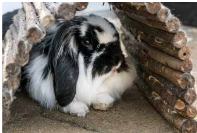
Konijnen vinden tunneltjes erg leuk.

Daarnaast kunnen konijnen ook erg goed graven. Op deze manier kunnen ze ontsnappen en niet iedereen wordt even blij als de tuin als tunnelstelsel wordt gebruikt. Als de konijnen in een ren zitten, zijn er twee effectieve manieren om gravend ontsnappen tegen te gaan: de ondergrond betegelen of gaas ingraven op een bepaalde diepte onder de grond. Bij het ingraven van gaas kunnen de konijnen toch nog lekker graven zonder zich uit te kunnen graven. Het nadeel is dat het gaas onder de grond op langere termijn kapot kan gaan en dat heb je vaak niet in de gaten.