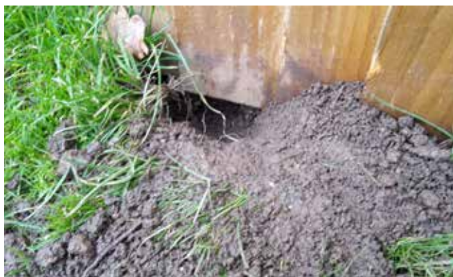
Konijnen zijn ontsnappingskunstenaars.

Niet alleen bij ons is het gras bij de buren groener, ook voor konijnen geldt dat. Veel konijnen zijn erg goed in ontsnappen. Wanneer je gebruik maakt van een ren, zorg er dan voor dat deze hoog genoeg is. Konijnen hebben sterke achterpoten en kunnen daardoor heel hoog springen. Over een hekje van 60 cm springen ze met gemak heen. Gebruik een minimale hoogte van 80 cm en liever nog 1 m. Er zijn (puppy)rennen verkrijgbaar met deurtjes, dus dan hoef je zelf niet zo hoog te springen... Als de ren los staat, houd er dan rekening mee dat konijnen de ren ook kunnen optillen en er dan onderdoor gaan. Tentharingen of iets dergelijks verhelpen dit. Kijk ook goed naar de grootte van de mazen van de ren, konijnen kunnen door veel kleinere gaten kruipen dan je in eerste instantie zou denken.