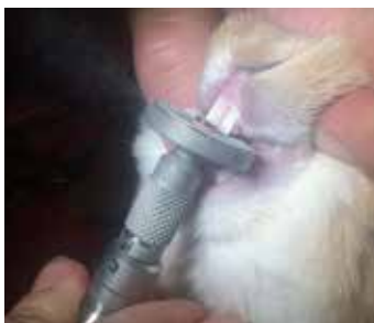
Een dierenarts slijpt de voortanden.

Het gebit van het konijn groeit altijd door. Dat betekent dat het gebit dus ook altijd slijt. Zoals eerder besproken gebeurt dit vooral door het eten van hooi. Ook de betere merken korrels dragen bij aan de slijtage. Knaagstenen, verkrijgbaar in veel dierenwinkels, zijn dodelijk voor konijnen! Koop deze dus niet voor het afslijten van de tanden van je konijn. Dit kan bijvoorbeeld blaasstenen en blaasgruis veroorzaken. Bij sommige konijnen groeien de tanden en/of kiezen niet helemaal netjes op elkaar. Dit zorgt er dus ook voor dat de tanden/ kiezen niet netjes afslijten. Als het konijn niet goed eet, vermagert of niet door blijft eten, kan het zijn dat de tanden en/of kiezen niet goed zijn. In dit geval kan de dierenarts de tanden of kiezen van het konijn vijlen of slijpen, zodat het konijn wel goed kan eten. Tand en kiezen mogen vanwege het risico op splijten en als gevolg daarvan ontstekingen niet geknipt worden. Als de voortanden erg slecht zijn en ze constant door blijven groeien, is het zelfs mogelijk ze te laten trekken (anders moeten ze iedere paar weken geslepen worden). Het probleem is dan opgelost en het konijn redt zich prima zonder voortanden. Alleen het groenvoer moet je dan in reepjes snijden.