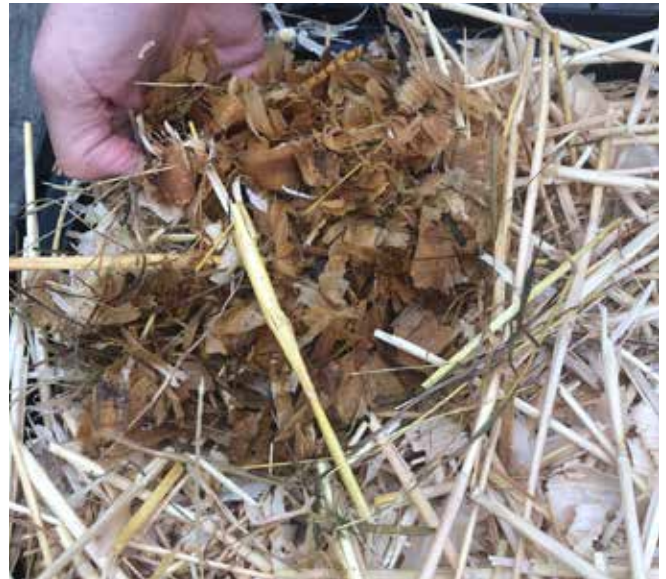
Haal 1x per dag de natte plekken uit het verblijf.

Voor de gezondheid van je konijnen, maar ook tegen stank en ongedierte, is het belangrijk om regelmatig het verblijf schoon te maken. Meestal zijn konijnen zindelijk, ze doen hun behoefte vaak op één plek in het verblijf. Je kunt hier een rechthoekige toiletbak (driehoekige zijn vaak te klein) plaatsen gevuld met een goed absorberende bodembedekking die je makkelijk kan legen en schoonmaken. Eén keer per dag de toiletbak(ken) verschonen en eventueel keutels opvegen volstaat meestal en dan één keer per week het hele verblijf leeg- en schoonmaken met een niet-agressief schoonmaakmiddel (bijvoorbeeld schoonmaakazijn). Op deze manier is het niet veel werk, maar zitten de konijnen wel in een schone ruimte.